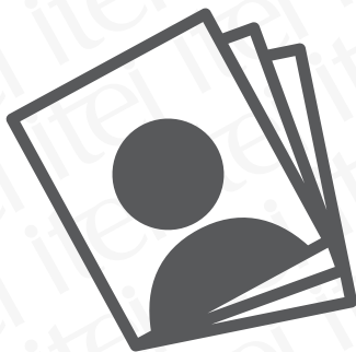
Fotos y videos

No toda tu información debe ser pública, ¡Protégela!