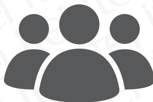
La información de tus contactos o amigos.

Tus datos como son: correo electrónico, domicilio, Teléfono, número celular, fechas de cumpleaños