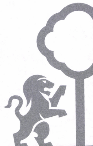
Imagen 4