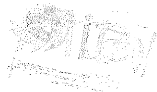
Mtro. Miguel Ángel Hernández Velázquez Secretario Ejecutivo del Instituto de Transparencia, Información Pública y Protección de Datos Personales del Estado Jalisco

Publíquese en la página web del Instituto el presente acuerdo.