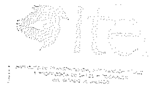
Mtro. Miguel Ángel Hernández Velázquez Secretario Ejecutivo del Instituto de Transparencia, Información Pública y Protección de Datos Personales del Estado Jalisco

Publíquese en la página web del Instituto el presente acuerdo.