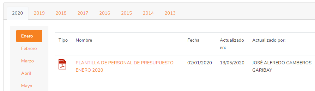
PRESUPUESTO DE EGRESOS PLANTILLA DE PERSONAL DE CARACTER PERMANENTEEnte público de PLANTILLA DEPRESUPUESTO 2020 COMPLETAEjercicio fiscal 2020