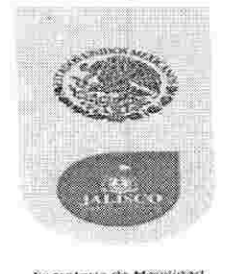
Secretaría de Movilidad

2. El día 22 veintidós de septiembre de 2016 dos mil dieciséis, el sujeto obligado emitió respuesta a la solicitud de información mediante oficio SM/DGJ/UT/7273/2016, suscrito por el Titular de la Unidad de Transparencia de la Secretaría de Movilidad, lo cual hizo en los siguientes términos: